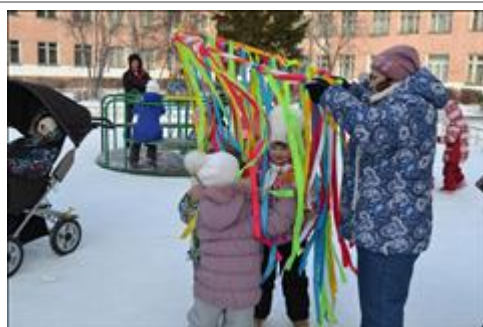
Добрая Масленица Инклюзивное мероприятие посвященное масленице. Горячий чай с блинами, конкурсы на свежем воздухе.