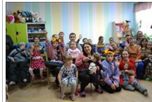
Мы разные - в этом наше богатство! Весёлое чаепитие в рамках праздника