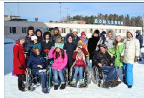
Коллектив инклюзивной студии "Э-Мощия" в Снежинске Пример мужества и силы!

Мероприятие: Более 30 детей-инвалидов прошли курс занятий терапевтическим спортом в рамках программы "Льжи мечты. Ролики"