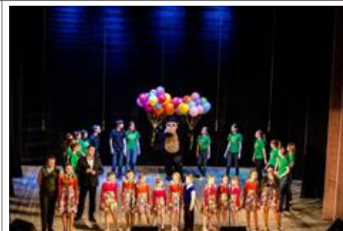
День рождения "Бумеранг Добра" День рождения - праздник "особенного детства"!