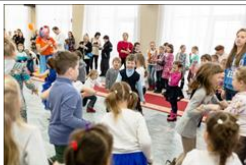
Праздничная программа Вместе весело шагать!