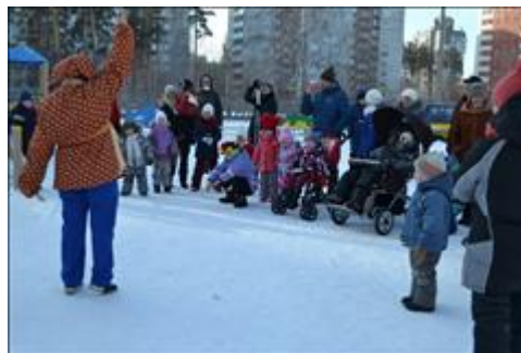
Подари ребёнку радость Инклюзивное праздничное мероприятие

Мероприятие: Проведены мероприятия в рамках рождественской акции "Подари ребенку радость" с участием более 60 неорганизованных детей