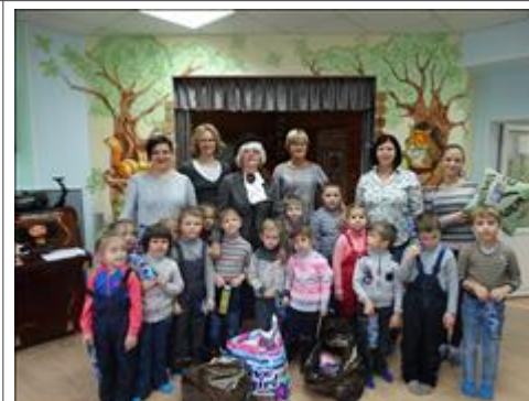
Друзья в гостях Экскурсии из общеобразовательных школ и дошкольных учреждений в Центр помощи детям "Бумеранг добра", с целью развития чувства взаимопомощи и толерантности.

Мероприятие: Проведен праздник для весенних именинников «День рождения – праздник детства» с участием более 100 детей