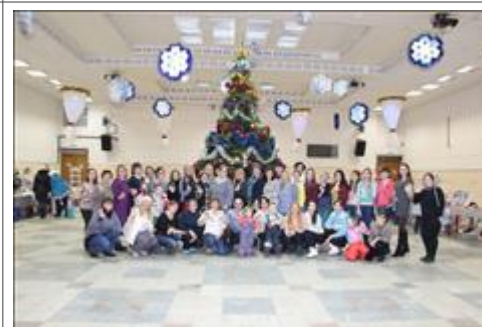
Общероссийская Благотворительная ярмарка ручных работ. Все вырученные средства адресно передаются конкретной семье, воспитывающей ребёнка-инвалида для оплаты дорогостоящего лечения или приобретения технического средства реабилитации.