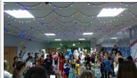
Инклюзивный ежегодный новогодний утренник Театрализованное новогоднее представление для "особенных" детей от партнеров "Воинская часть 3468"