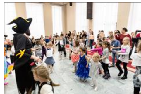
Анимационная программа на тему "Добро и зло" Особое детство вместе с обычным. День рождения в кругу друзей!