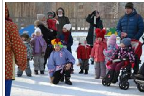
Подари ребёнку радость Аннимационная программа в рамках мероприятия "День "особенного именинника""