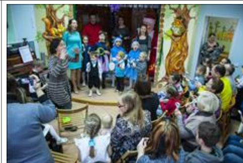
Рождественская сказка Сотрудничество с "Воскресной школой-Державная", субботний досуг