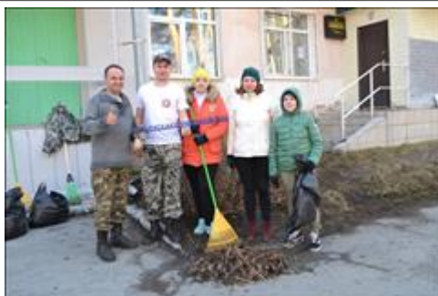
Добрый субботник на территории Центра помощи детям "Бумеранг Добра" Совместное мероприятие: родители вместе с детьми с ограниченными возможностями здоровья, волонтеры, представители городских организаций. Общий труд, как средства социализации и коммуникации.