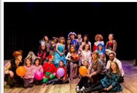
Впервые в Снежинске инклюзивная театральная студия "Э-Моция", г. Казань Страна сломанных игрушек – история девочки Лии, которая отправляется на поиски своего медвежонка пострадавшего во время аварии. В основе сюжета попытка творческого осмысления опыта работы инклюзивной студии, процессов свойственных всем людям: преодоление страхов, принятия себя, рождение доверия и дружбы, движения к мечте.