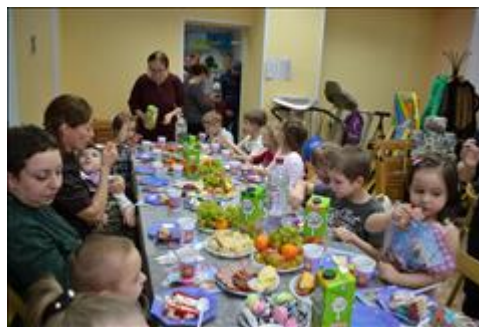
Мы вместе - в этом наша сила!