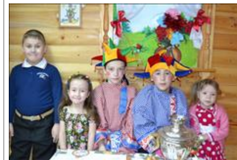
Театральный кружок "Весёлые скомарохи"