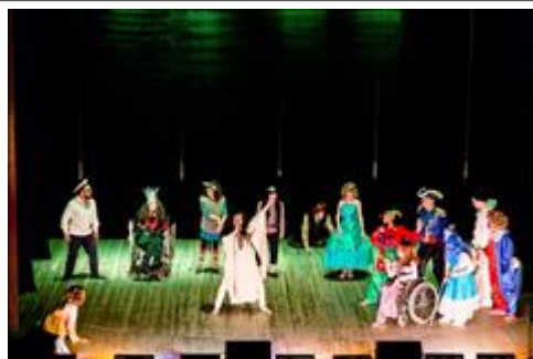
Инклюзивная театральная студия "Э-Мощия", г. Казань Постановка "Страна сломанных игрушек". В основе сюжета попытка творческого осмысления опыта работы инклюзивной студии, процессов свойственных всем людям: преодоление страхов, принятия себя, рождение доверия и дружбы, движения к мечте. ДК "Октябрь", г. Снежинск