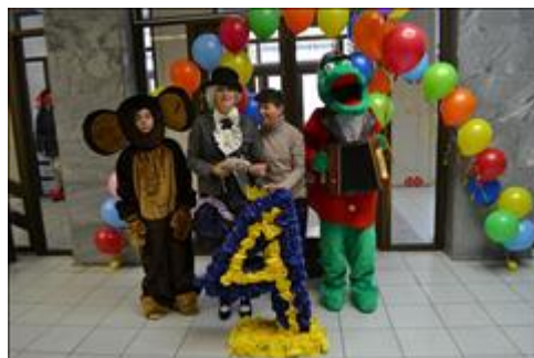
День "Особенных" именинников Особый зверёк "Чебурашка" выбран как символ не обычного детства. Ростовые куклы Крокодила Гены и Чебурашки выполнены руками бабушки, воспитывающей ребёнка-инвалида.