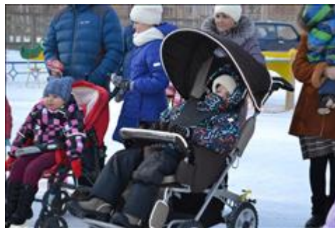
Мы Есть! Город - "Единство непохожих"