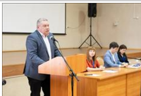
Доклады Выступление участников семинара на открытии отделения ВОРДИ