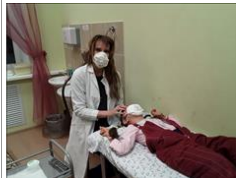
Логомассаж Логомассаж в условиях пандемии

Мероприятие: Комплекс семинаров и консультаций для повышения уровня образования специалистов и родителей в области специальной (коррекционной) педагогики и психологии ККТ 1.1, 1.2, 1.3, 1.5