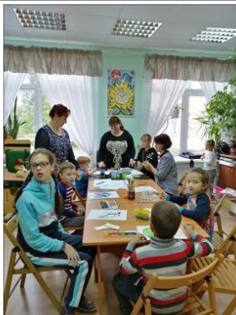
Работа с краской Рисование акварелью