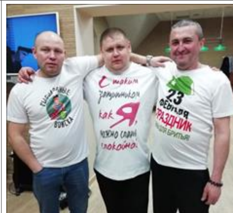
продукция минитипографии Фото заказчиков в продукции минитипографии "Одной левой"