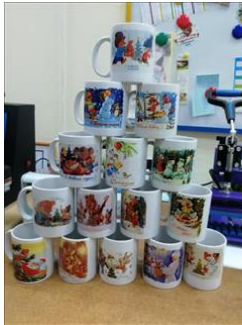
Кружки "Одной левой" Продукция минитипографии