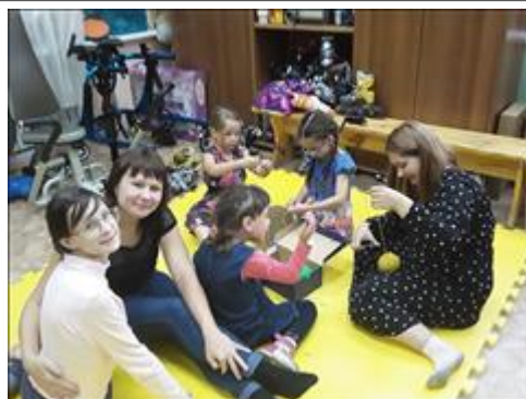
Учимся шнуровке Перед тем, как встать на ролики, надо научиться шнуровать ботинки! Занятие в группе "Передышка"