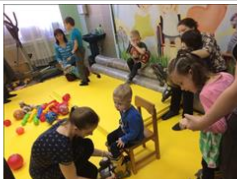
в группе "Передышка" Подготовка к занятию в группе "Передышка" в системе сопровождения семей