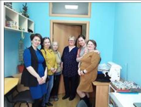
Рука об руку Встреча-семинар с дружественной организацией "Рука об руку"