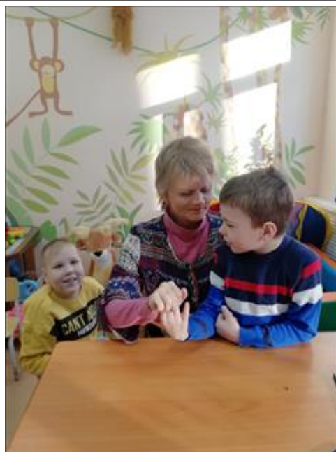
Обучение взаимодействию Взаимодействие несоциализированных инвалидов с тяжёлыми диагнозами и детей, посещающих Центр