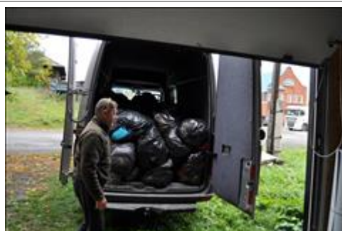
Сбор благотворительной помощи подготовка к развозу собранной благотворительной помощи для тяжело больных жителей Булзей, Верхнего Уфалея