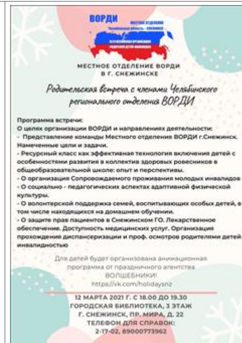
программа мероприятия ВОРДИ Программа родительской встречи-семинара на открытии местного отделения ВОРДИ

Мероприятие: Непрерывное сопровождение семей инвалидов с различными ограничениями жизнедеятельности: патронажная служба для неорганизованных детей с тяжёлыми формами заболевания ККТ 1.1, 1.4