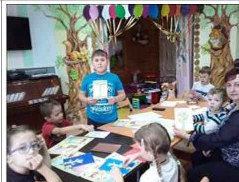
Работа с бумажными материалами Дети, посещающие группу "Передышка", со своим воспитателем