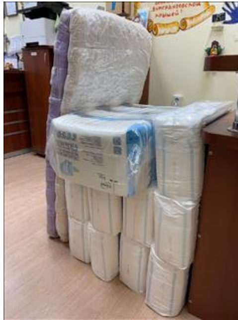
Гигиенические средства Памперсы, пелёнки и матрасы, собранные патронажной службой