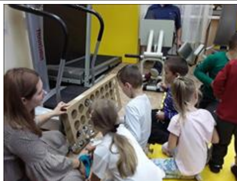
Задание на координацию Развитие и укрепление межполушарного взаимодействия