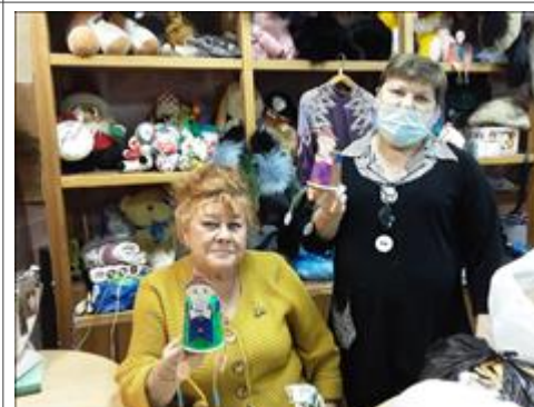
Волонтеры Женсовета В городском Женсовете идёт сбор благотворительной помощи в натуральном виде