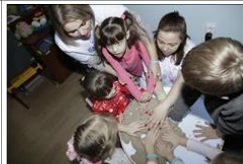
Пескотерапия Новый сенсорный опыт на занятии по пескотерапии