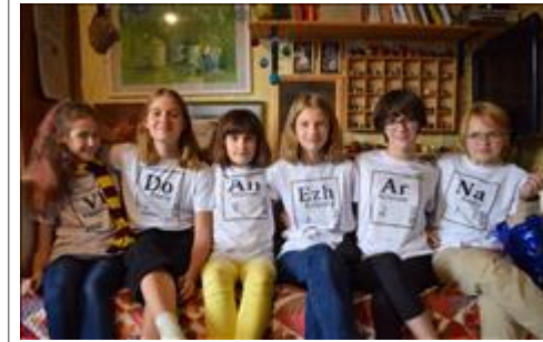
ребята в футболках из минитипографии Оригинальный дизайн футболок в типографии "Одной левой"

Электронные версии материалов (бюллетеней, брошюр, буклетов, газет, докладов, журналов, книг, презентаций, сборников и иных), созданных с использованием гранта в отчетном периоде (при условии, что такие материалы не содержатся в материалах, указанных в подпункте 5 настоящего пункта)