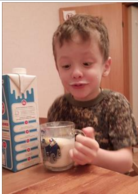
молоко A2 Advalac Натуральное молоко для детей на безказеиновой диете доставлено средствами патронажной службы