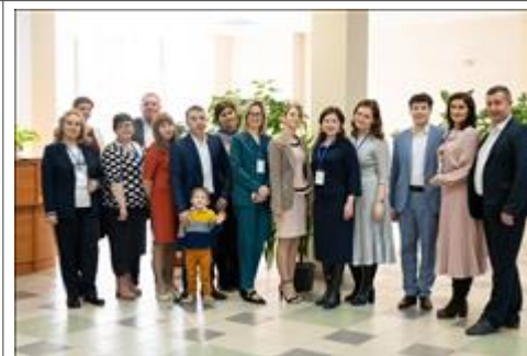
открытие местного отделения ВОРДИ Высокие гости из области на открытии отделения ВОРДИ в Снежинске силами "Бумеранга добра"

Программа курса Программа трёхдневного курса семинаров "Как правильно помочь ребенку с аутизмом и его семье"