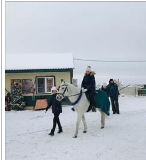
Иппотерапия под открытым небом Занятие по иппотерапии в конно-спортивном клубе "Навада", партнёре проекта