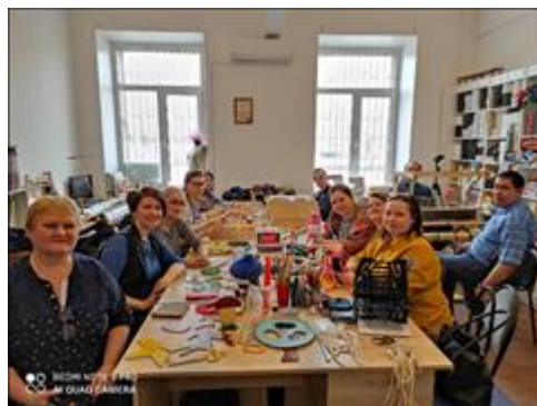
Обучающий семинар-практикум Руководители и специалисты Центра, отвечающие за работу инклюзивных мастерских, обменялись опытом и прошли обучение техникам, применяемым в студии рукоделия и машинного вязания для людей с ментальной инвалидностью "Рука об руку" в г. Челябинске