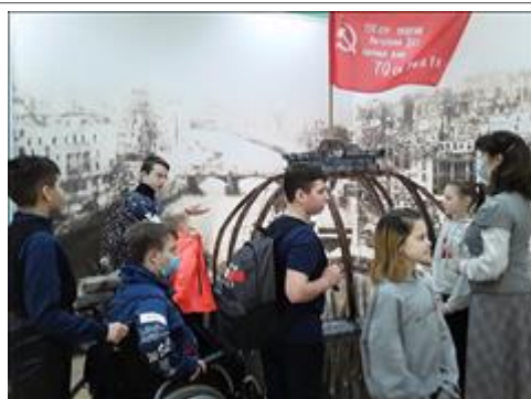
Посещение музея Посещение городского музея с клубом молодых инвалидов "Шанс"

Информация из этого раздела будет доступна для посетителей сайта оценка.гранты.рф (в том числе для представителей СМИ).