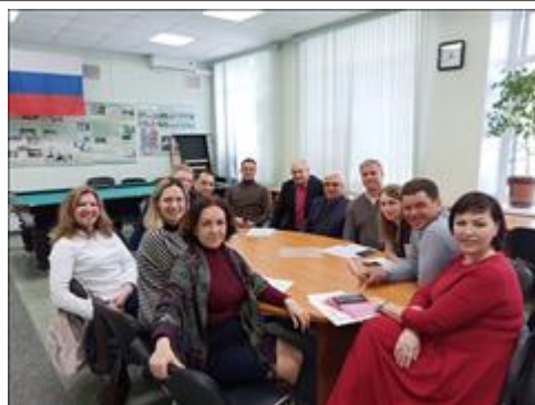
Совет НКО "Бумеранг добра" на встрече-семинаре совета НКО при ОБУ «Региональный центр спортивной подготовки по адаптивным видам спорта Челябинской области»