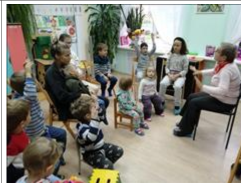
Логоритмика Логоритмика в "Передышке"