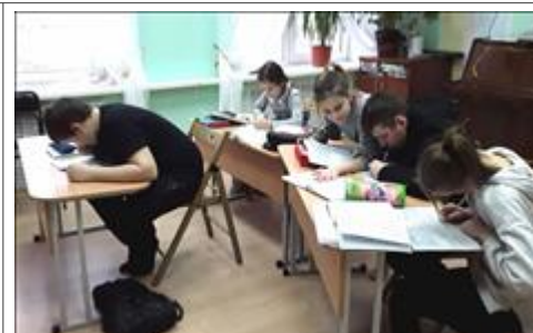
Продлёнка Занятие в рамках направления "Продлёнка" в системе сопровождения семей на базе Центра