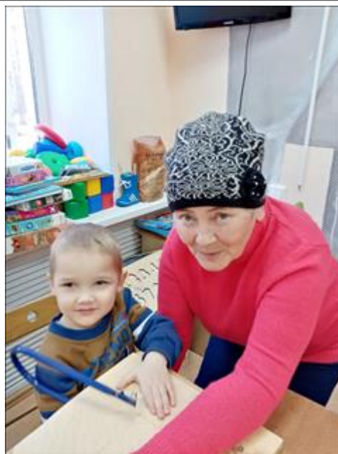
От мала до велика в столярной мастерской