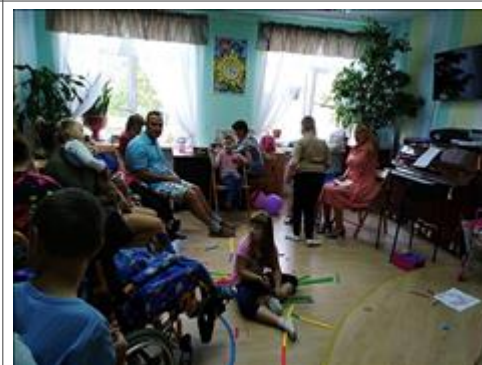
Музыка для всех Музыкальное занятие