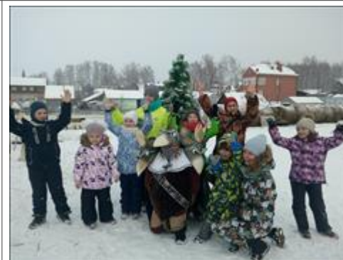
После занятия После занятия по иппотерапии на новогодних каникулах