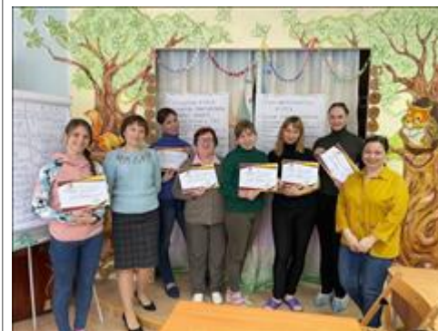
Вручение сертификатов По завершении трёхдневного курса семинаров "Как правильно помочь ребенку с аутизмом и его семье"